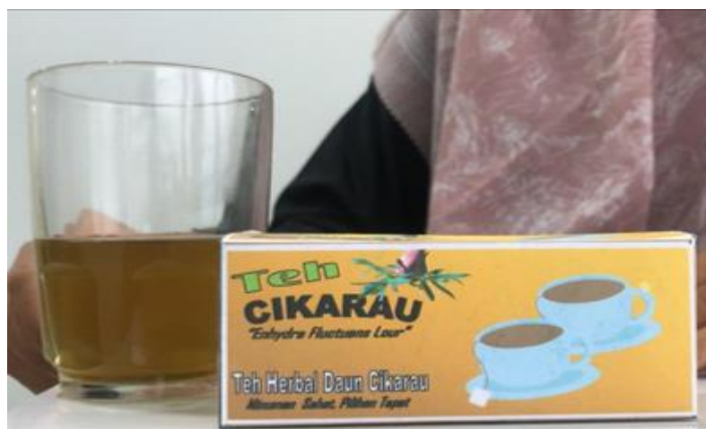
Gambar 2. Teh Cikarau terlihat bentuk

Kemasan ini dengan konsep sederhana, masih sifatnya umum dari segi warna, foto produk, tipografi, warna dan lainnya. Pemilihan jenis kemasan belum sempurna maka perlunya dianalisis dari segi media kemasan yang sudah dilakukan.