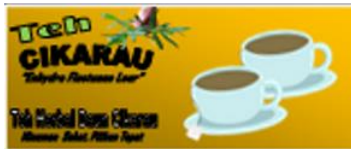
Gambar 1. Kemasan Teh Cikarau Tampak Depan

Selain rasa dan aromanya yang khas, Teh Cikarau Padang juga menarik perhatian dengan desain kemasannya yang unik dan menarik. Kemasan Teh Cikarau biasanya terbuat dari bahan-bahan tradisional seperti bambu dan kayu, dengan desain yang mencerminkan budaya Minangkabau. Penggunaan bahan tradisional ini tidak hanya memberikan sentuhan estetika, tetapi juga ramah lingkungan dan mendukung kelestarian alam.