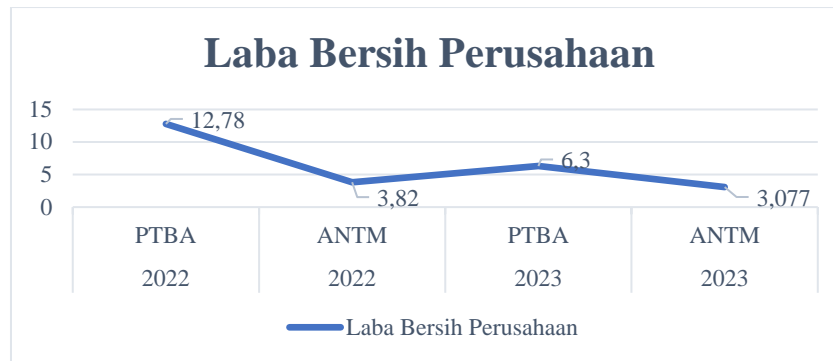
Gambar 1. Penurunan Laba Bersih Perusahaan PTBA dan ANTM tahun 2022-2023