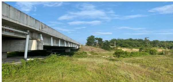
Gambar 1. Terowongan Gajah pada Ruas Jalan Tol Pekanbaru-Dumai Sumber: dokumentasi peneliti, 2024

Kehadiran Tol Permai tak hanya memberikan kemudahan infrastruktur transportasi kepada para pelaku ekonomi, tetapi juga telah membantu menjaga kelestarian habitat satwa gajah dan fauna lainnya di sekitar lokasi jalan tol karena adanya terowongan khusus satwa (Rindi Yuliyanti & Purbaningrum, 2022). Jalan Tol Pekanbaru - Dumai melintasi area perkebunan, tanah mineral, dan hutan serta ke beragaman flora fauna yang hidup tumbuh dan berkembang. Jalan tol Pekanbaru - Dumai ini mulai beroperasi pada tanggal 25 September 2020.