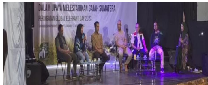
Gambar 12. Kegiatan perayaan hari gajah sedunia Bincang Konservasi dan Panggung Seni Musik Peran Lapisan Masyarakat Dalam Upaya Melestarikan Gajah Sumatera

Peran pasif adalah sumbangan anggota kelompok yang bersifat pasif, dimana anggota kelompok menahan diri agar memberikan kesempatan kepada fungsi - fungsi lain dalam kelompok sehingga berjalan dengan baik, yang mana peran pasif ini merupakan upaya yang dapat dilakukan oleh Rimba Satwa Foundation dalam mendorong masyarakat untuk peduli terhadap habitat gajah.