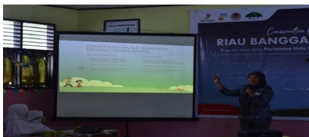
Gambar 11. Sosialisasi ke SDN 25 Mandau

Selanjutnya Rimba Satwa Foundation memberikan edukasi ke SDN 25 Mandau yang dimana materi ini disampaikan langsung oleh Ibu Solfarina, S.Pd. Adapun materi yang dijelaskan adalah penjelasan mengenai hutan yang merupakan suatu kesatuan ekosistem berupa hamparan lahan yang berisi sumber daya alam hayati yang didominasi pepohonan dalam persekutuan alam lingkungannya yang satu dengan yang lainnya.