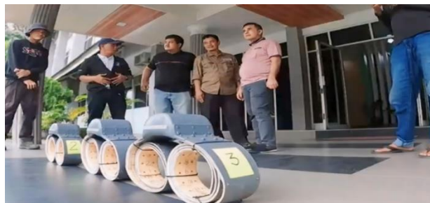
Gambar 4. Bentuk GPS Collar

Rimba Satwa juga menggunakan teknologi seperti GPS dan kamera trap untuk melacak pergerakan gajah liar. Data yang dikumpulkan dapat membantu memahami pola pergerakan gajah dan merencanakan intervensi yang lebih efektif untuk terowongan gajah yang ada di jalan tol Pekanbaru - Dumai. Pemasangan GPS collar pada gajah liar di terowongan jalan tol Pekanbaru - Dumai adalah salah satu upaya penting untuk memantau pergerakan dan memastikan keselamatan gajah dikawasan tersebut.