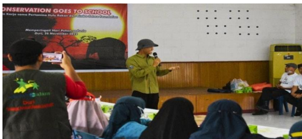
Gambar 10. Sosialisasi dan edukasi ke sekolah terkait pengenalan kehidupan satwa

Dalam pelaksanaan conversation goes to school Rimba Satwa Foundation akan memberikan pengalaman edukatif yang mendalam dan menyeluruh kepada siswa - siswi dimulai dengan mengenalkan berbagai jenis satwa yang dilindungi di Indonesia. Satwa - satwa ini meliputi gajah sumatera yang terkenal dengan ukuran tubuhnya yang besar namun semakin langka.