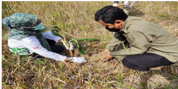
Gambar 6. Penghijauan serentak diseluruh jalan tol operasi PT. Utama Karya

Rimba Satwa Foundation melakukan penelitian untuk mengidentifikasi jenis makanan kesukaan gajah dan kebutuhan habitat yang ideal. Informasi ini menjadi dasar pemilihan jenis tanaman yang akan ditanam di sekitar terowongan jalan tol Pekanbaru - Dumai. Bersama dengan Utama Karya dan BBKSDA Riau, Rimba Satwa melakukan program pembinaan habitat yang mencakup penanaman tanaman yang disukai gajah dan koridor satwa liar. Rimba Satwa membantu dalam pengaturan tata letak dan jenis tanaman untuk memastikan bahwa gajah memiliki akses yang mudah dan aman ke sumber makanan.