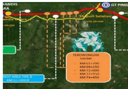
Gambar 2. Denah Lokasi 6 Titik Terowongan Gajah

fauna terutama gajah yang mempunyai kebiasaan berpindah tempat (Januarfitra et al., 2021). Maka dari itu dengan memperhatikan jalur perpindahan gajah yang sudah di monitor oleh BBKSDA Riau dan luas kawasan yang semakin menyusut maka perlu di desain terowongan gajah sebagai bentuk harmonisasi infastruktur dengan alam. Struktur ini disebut dengan underpass gajah yang dilengkapi dengan lansekap berupa tanaman hijau yang dapat menarik minat gajah untuk melintasinya.