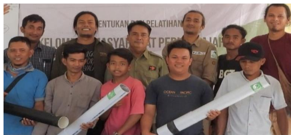
Gambar 7. Pembentukan dan pelatihan kelompok masyarakat peduli gajah

Pembentukan Kelompok masyarakat peduli gajah bertujuan untuk meningkatkan partisipasi dan kesadaran masyarakat dalam menjaga keberlangsungan populasi gajah dan habitatnya. Kelompok masyarakat peduli gajah menjadi perpanjangan tangan dari upaya konservasi gajah dan berfungsi sebagai garda terdepan dalam menjaga keseimbangan antara kehidupan manusia dan satwa liar di lingkungan yang terdampak.