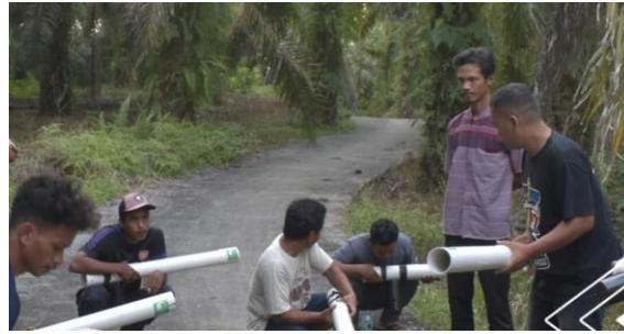
Gambar 8. Pelatihan menggunakan meriam angin berbahan spirtus oleh kelompok masyarakat peduli gajah

Materi dan pelatihan yang disampaikan oleh Rimba Satwa Foundation itu sama di 6 desa yang telah terbentuk kelompok masyarakat peduli gajah.