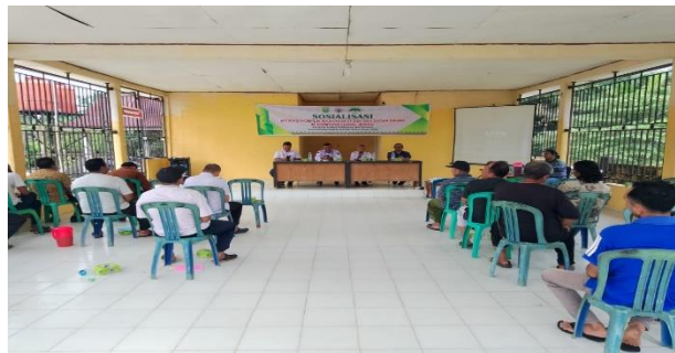
Gambar 9. Sosialisasi mitigasi konflik antara gajah dan manusia di Desa Lubuk Jering

Sosialisasi kepada masyarakat bertujuan untuk mengedukasi masyarakat tentang pentingnya peduli terhadap gajah serta cara - cara peduli terhadap gajah serta cara - cara untuk mengurangi konflik antara manusia dan gajah. Melalui kegiatan ini Rimba Satwa Foundation berharap masyarakat dapat memahami perilaku gajah, pentingnya melestarikan habitat mereka, dan langkah - langkah yang dapat diambil untuk meminimalisir konflik yang mungkin terjadi.