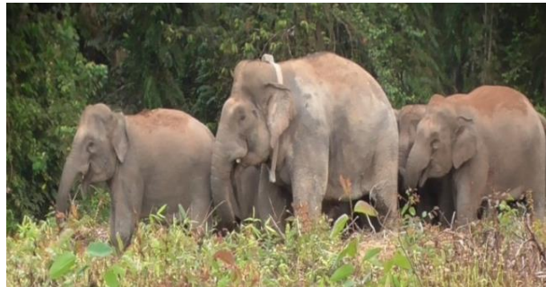
Gambar 5. Gajah yang dipasang GPS Collar

Identifikasi dan pemilihan gajah tim konservasi yang terdiri dari ahli biologi, dokter hewan, dan staff Rimba Satwa terlebih dahulu mengidentifikasi gajah yang akan dipasang GPS Collar. Gajah dipilih berdasarkan usia kesehatan, dan peran dalam kawanan. Sudah sekitar 7 gajah yang memakai GPS Collar yang terdiri dari gajah dewasa betina yang sedang mengandung, gajah jantan pemimpin kelompok dan perwakilan 1 diantara kelompok gajah liar.