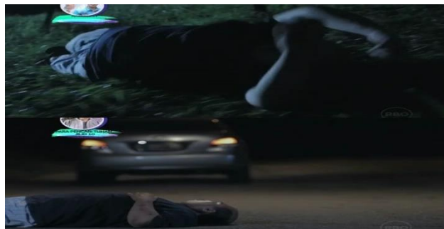
Gambar 7. Scene 1:14:45

Data 7 menunjukkan bahwa adegan ini menggambarkan Hendra, kakak Angel yang memiliki keterbatasan mental, mengalami kecelakaan tragis dan tertabrak mobil. Kejadian ini terjadi saat Hendra sedang berjalan sendirian di jalan. Adegan ini merupakan momen dramatis yang membawa dampak besar bagi karakter Angel. Setelah insiden ini, Angel sangat terpuakul dan menyesali banyak hal, terutama bagaimana ia terkadang kurang sabar atau tidak sepenuhnya memahami Hendra.