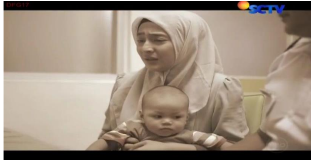
Gambar 12. Scene 1:38

Data 12 menunjukkan bahwa adegan ini sangat menyentuh di mana ibu Hendra mendengar dari dokter bahwa anaknya memiliki kebutuhan khusus. Adegan ini penuh dengan kesedihan dan menggambarkan perasaan yang kompleks sebagai seorang ibu. Saat dokter menyampaikan kabar tersebut, ibu Hendra mengalami campuran perasaan antara syok, sedih, dan cemas tentang masa depan anaknya. Meski sulit menerima kenyataan ini, ia bertekad untuk merawat dan mencintai Hendra sepenuh hati, tanpa memandang keterbatasannya.