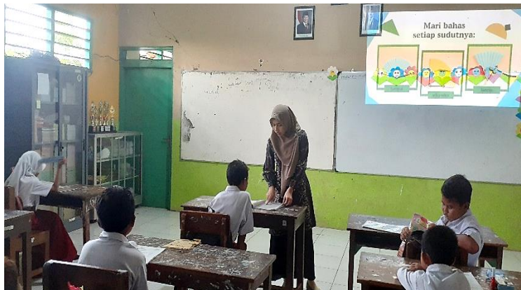
Gambar 2. Pelaksanaan prasiklus

Berdasarkan hasil tes pada pra siklus yang disajikan dalam Tabel 1, diketahui bahwa rata-rata nilai peserta didik adalah 45,4 dengan hanya 3 peserta didik (25%) memperoleh nilai \geq 70 dan dinyatakan tuntas belajar secara individu. Sementara itu, 9 peserta didik (75%) memperoleh nilai di bawah 70, sehingga belum mencapai ketuntasan individu. Penyebab rendahnya hasil belajar pesesrta didik ini karena guru kurang memanfaatkan variasi model dan media pembelajaran, sehingga pembelajaran terkesan monoton. Selain itu, peserta didik masih mengalami kesulitan dalam memahami konsep sudut. Hasil pada pra siklus ini mendasari perancangan pembelajaran siklus berikutnya yang mengadopsi model PBL berbantuan media Jam Sudut untuk peningkatan hasil belajar peserta didik.