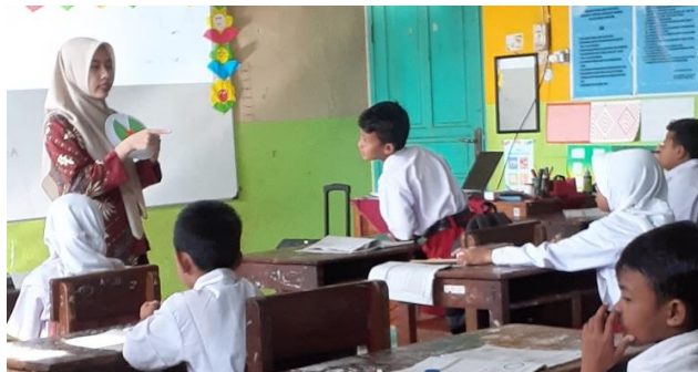
Gambar 3. Pelaksanaan Siklus 1