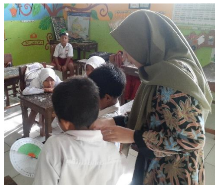
Gambar 4. Pelaksanaan siklus II

Pelaksanaan kegiatan pembelajaran siklus II dilakukan berdasarkan hasil refleksi siklus I dengan langkah pembelajaran yang sama. Namun, pada tahap kegiatan inti, peneliti lebih memfokuskan peserta didik dalam menggunakan media jam sudut. Peserta didik diberikan kesempatan untuk mencoba media pembelajaran tersebut satu persatu maju ke depan dan memberikan kesempatan untuk bertanya mengenai apa yang kurang dipahami. Selain itu, peneliti juga menghubungkan materi pembelajaran dengan budaya sekitar mereka, seperti mengaitkan bangunan menara Kudus dengan materi jenis-jenis sudut. Dengan mengaitkan materi dengan budaya sekitar, peserta didik dapat memahami konsep-konsep lebih dalam dan lebih baik, karena mereka melihat bagaimana konsep-konsep tersebut diterapkan dalam kehidupan nyata.