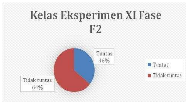
Gambar 1. Persentase ketuntasan hasil belajar kelas eksperimen

Berdasarkan data pada tabel, siswa pada kelompok eksperimen lebih mungkin menyelesaikan pelajaran dibandingkan siswa pada kelompok kontrol. Dari jumlah siswa tersebut, 9 (36% dari total) kelas eksperimen menyelesaikan tes, sedangkan 16 (64% dari total) tidak menyelesaikan tes. Pada kelompok kontrol, terdapat 6 siswa atau 20,69 persen yang telah menyelesaikan pembelajaran, sedangkan 29 siswa atau 79,31 persen belum siap mengikuti tes. Representasi diagram % penyelesaian kelas berikut tersedia. Diagram Persentase Ketuntasan Hasil Belajar Kelas.