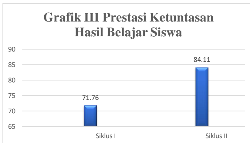
Gambar 3. Analisis hasil belajar siswa siklus I dan siklus II

Diketahui pada siklus I terdapat 10 siswa yang telah mencapai ketuntasan belajar dengan presentase 58,82% sementara 7 orang siswa lainnya belum tuntas yakni 41,17% dengan nilai rata-rata yang diperoleh yaitu 71,76%, dan nilai tertinggi pada siklus I yaitu 90 dan nilai terendah 40 sehingga pada siklus I dinyatakan belum mencapai KKM yang ditentukan sehingga dilanjutkan pada siklus II. Pada siklus II, terdapat peningkatan dari 10 siswa yang tuntas pada siklus I menjadi 15 siswa yang tuntas pada siklus II dengan presentase 88,23% dan 2 siswa yang tidak tuntas dengan presentase 11,76% dan rata-rata 84,11%, dan nilai tertinggi yaitu 100 dan nilai terendah yaitu 60. Hal ini menunjukkan bahwa pada siklus II sudah mencapai kriteria ketuntasan maksimum yaitu 80, jadi siklus II ini dikatakan berhasil. Dari hasil test siswa dapat disimpulkan bahwa pada siklus II siswa mengalami peningkatan, sehingga penerapan model pembelajaran cooperative learning tipe STAD dinyatakan berhasil.