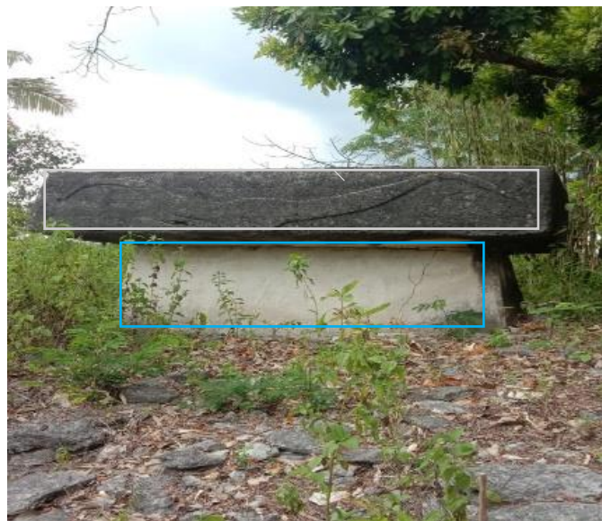
Gambar 3. Batu kubur padua tanah

Hubungan antara Bentuk geometris batu kubur padua tana dengan geometri pada perhitungan matematika. Tanduk kerbau dapat dikategorikan sebagai garis lengkung. Tanduk kerbau termasuk garis lengkung karena bentuk lengkungnya beraturan dan mengikuti pola tertentu dan tidak memiliki sudut sehingga secara matematika tanduk kerbau jelas dikategorikan sebagai garis lengkung.