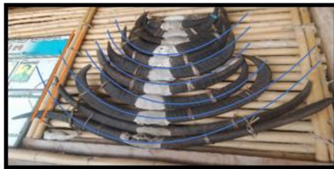
Gambar 1. Tanduk kerbau dan banbu yang berhimpitan

Berdasarkan hasil analisis data, dapat disimpulkan bahwa keberadaan batu kubur padua tana bukan hanya sekedar penanda sejarah, melainkan simbol perdamaian dan pembuatan ukiran pada hiasan batu kubur Padua Tana juga memiliki makna yang sangat mendalam. Dahulu, ketika masyarakat melakukan upacara penyembelihan hewan kurban, mereka dapat menyembelih puluhan ekor kerbau sebagai bentuk persatuan dan kekuatan dari berbagai wilayah di sumba barat daya. Dari sekian banyak hewan yang disembelih, tanduk kerbau yang paling besar dipilsecara khusus untuk dijadikan model atau inspirasi ukiran pada batu kubur padua tana. Ukiran tanduk tersebut menjadi simbol kekuatan, kesatuan dan ketulusan upacara adat pada zamannya.