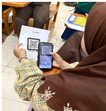
Gambar 2. Proses memindai QR Code

Sebelum proses pembelajaran dimulai, peneliti menyiapkan bahan ajar atau materi ajar. Materi tersebut kemudian diintegrasikan menggunakan media QR Code. Media QR Code ini digunakan dalam kegiatan pembelajaran siswa tentang materi walisongo dalam mata pelajaran PAI. Penelitian ini dilaksanakan pada saat kegiatan pembelajaran yang dilakukan oleh peneliti menggunakan media QR Code. Sebelum kegiatan pembelajaran dimulai, peserta didik diminta untuk mempersiapkan smartphone mereka untuk membantu proses pembelajaran, kemudian mereka diminta untuk memindai QR Code menggunakan smartphone mereka.