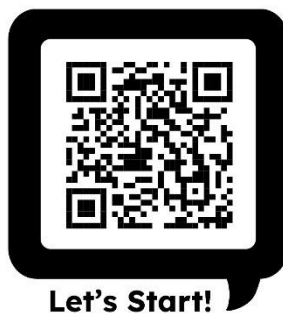
Gambar 1. Media belajar QR code

Code, (2) Arahkan pada QR Code yang akan dipindai, dan (3) Setelah aplikasi membaca kode, secara otomatis akan terkoneksi dengan internet kemudian membuka link video, browser situs, gambar, dan web. Berikut media ajar berbasis QR Code yang digunakan dalam penelitian ini.