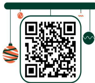
Gambar 4. QR code kuis

Setelah pemberian materi, selanjutnya peneliti membagikan QR Code yang di dalamnya berisi kuis tentang materi yang sudah mereka pelajari, yang kemudian akan dijawab oleh peserta didik. Berikut adalah QR Code yang dibuat oleh peneliti yang berisikan kuis dari tentang materi yang sudah dipelajari oleh peserta didik: