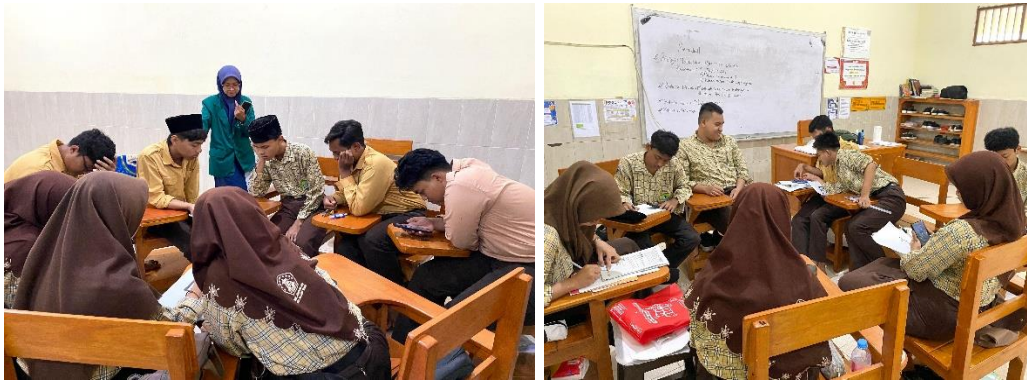
Gambar 3. Pelaksanaan pembelajaran

Setelah pemberian materi, selanjutnya peneliti membagikan QR Code yang di dalamnya berisi kuis tentang materi yang sudah mereka pelajari, yang kemudian akan dijawab oleh peserta didik. Berikut adalah QR Code yang dibuat oleh peneliti yang berisikan kuis dari tentang materi yang sudah dipelajari oleh peserta didik: