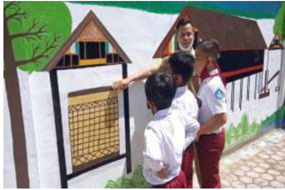
Gambar 2. Siswa melakukan observasi di sekolah

Keempat mengembangkan dan menyajikan hasil karya, pada tahap ini siswa diminta untuk merencanakan dan menyiapkan hasil pengamatan dan mempresentasikannya di depan kelas, kemudian guru membimbing dan mengarahkan siswa dalam diskusi kelas, serta memberikan kesempatan kepada kelompok lain untuk bertanya atau menanggapi. Tahap ini dapat dilihat pada Gambar 3.