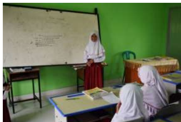
Gambar 6. Hasil dari kelompok kinestetik

Siswa yang cenderung memiliki gaya belajar kinestetik dapat memilih produk akhir dengan mendemonstrasikan pengelolaan kegiatan sekolah dengan menggunakan properti atau alat bantu untuk menjelaskan kegiatan sekolah yang telah dilakukan, dalam hal ini dengan mengeksplorasi secara langsung keragaman sosial budaya yang ada di sekitar sekolah. Sesuai dengan pernyataan (Azis et al., 2020) bahwa gaya belajar kinestetik lebih mudah menerima informasi melalui kegiatan praktik secara langsung. Hasil dari kelompok gaya belajar kinestetik adalah sebagai berikut