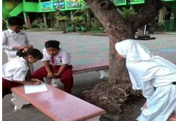
Gambar 5. Hasil dari kelompok pendengaran

Siswa dengan gaya belajar auditori lebih suka mendengarkan penjelasan atau berbicara saat presentasi di depan kelas. Siswa yang cenderung memiliki gaya belajar audio dapat membuat podcast, atau video singkat untuk menjelaskan kegiatan sekolah yang telah dilakukannya. Hasil produk dari kelompok gaya belajar auditori adalah sebagai berikut.