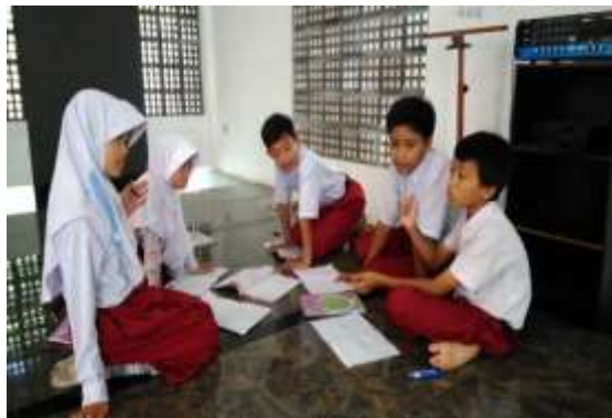
Gambar 3. Siswa mendiskusikan hasil produk perencanaan

Keempat mengembangkan dan menyajikan hasil karya, pada tahap ini siswa diminta untuk merencanakan dan menyiapkan hasil pengamatan dan mempresentasikannya di depan kelas, kemudian guru membimbing dan mengarahkan siswa dalam diskusi kelas, serta memberikan kesempatan kepada kelompok lain untuk bertanya atau menanggapi. Tahap ini dapat dilihat pada Gambar 3.