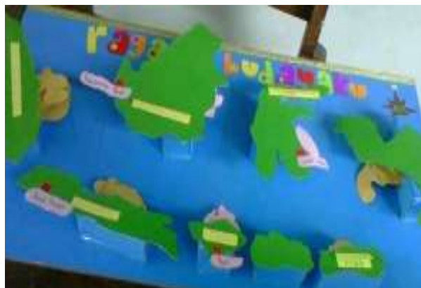
Gambar 4. Visual group product results

Siswa yang cenderung memiliki gaya belajar visual dapat memilih produk akhir berupa poster, cerita bergambar atau komik untuk menjelaskan hasil pengamatan mengenai keragaman sosial budaya di lingkungan sekolah yang telah mereka lakukan. Hasil produk dari kelompok gaya belajar visual adalah sebagai berikut.