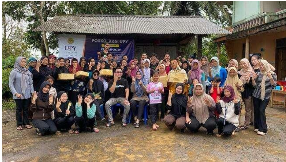
Gambar 9. Kegiatan H-1 minggu sebelum Ramadhan