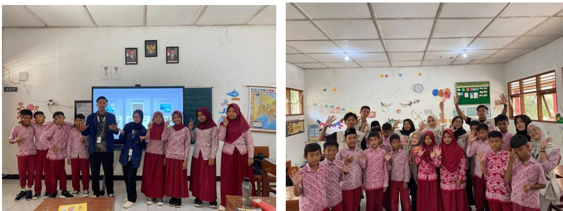
Gambar 1. Penerapan media pembelajaran interaktif dan motifa belajar siswa