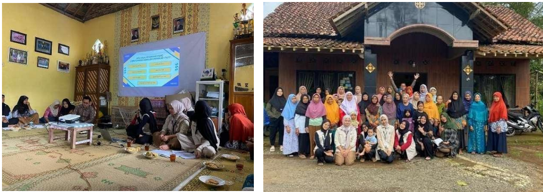
Gambar 3. Sosialisasi pernikahan dibawah umur untuk ibu PKK