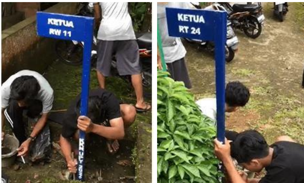
Gambar 6. Pembaruan papan nama (RT, RW dan DUKUH) Dusun Waru