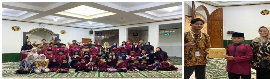
Gambar 7. Out bound TPA Masjid An-Nur