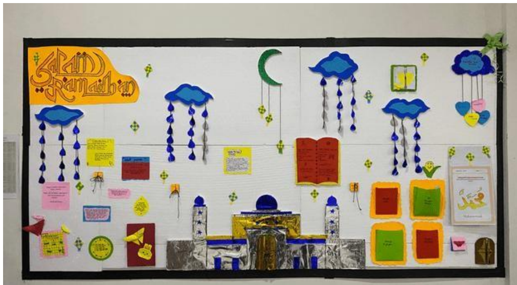
Gambar 4. Akreditasi TPA Masjid An- Nur