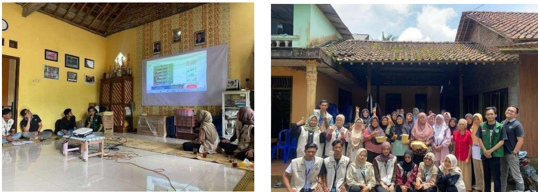
Gambar 5. Sosialisasi dan praktik pembuatan pupuk kompos Ibu PKK