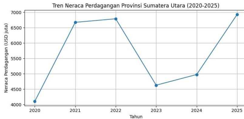
Gambar 3. Grafik neraca perdagangan

Hal ini menunjukkan bahwa impor mengalami peningkatan hingga tahun 2023 kemudian mengalami penurunan pada dua tahun berikutnya.